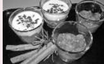
Vorschlag: servieren Sie dieses köstliche Dessert in einem schönen Sektglas oder Weinglas und verzieren Sie es mit der Vanillesobbe obendrauf!

Donnerstag, 24.12.09 vor! Diese sind sicher sowie sauber von uns Einwegverpackt und somit gekühlt 3-4 Tage haltbar. Einfach zuhause im Topf, Keramikschale im Umlufttherd (abgedeckt) od. Mikrowelle erwärmen. Schon ab 1 Portion möglich.